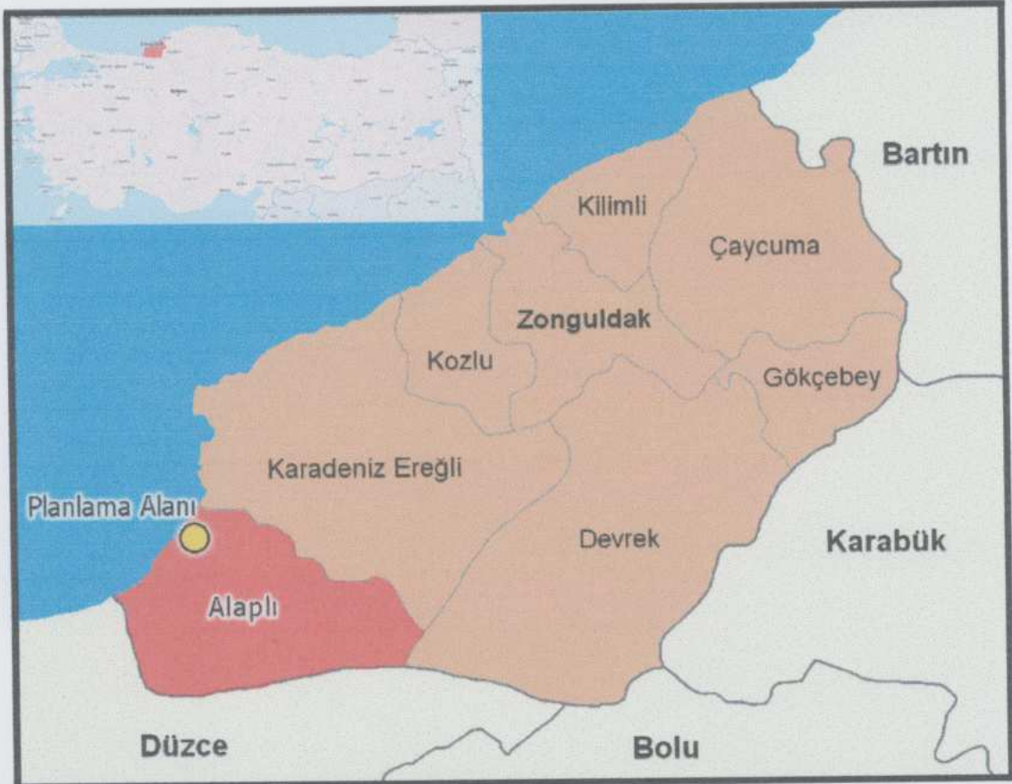
Şekil 1. Planlama Alanının Ülkesi ve Bölgesi İçindeki Konumu.

Planlama Alanı Batı Karadeniz Bölgesi içinde yer alan Zonguldak ili, Alaplı İlçesi sınırları içinde, ilçe merkezinde yer almaktadır.