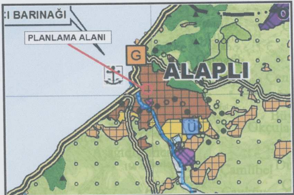
Şekil 4. Zonguldak-Bartın-Karabük Planlama Bölgesi 1/100.000 Ölçekli Çevre Düzeni Planı.

Ayrıca plan notlarının VI.5.2. maddesinde kentsel yerleşik alanlarda, konut alanları ile birlikte kentsel sosyal altyapı alanları ile kentsel servis alanları kapsamındaki kullanımların yer alabileceği belirtilmiştir.