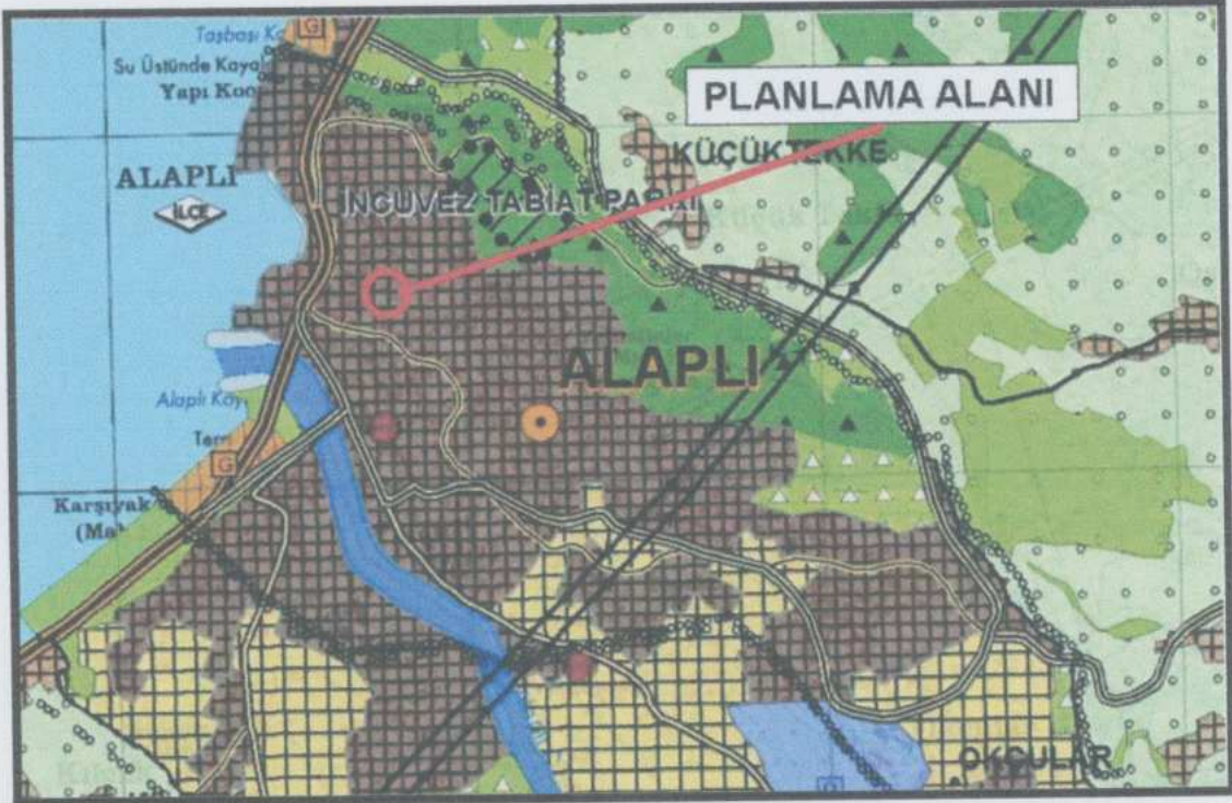
Şekil 5. Zonguldak İli 1/25.000 Ölçekli Çevre Düzeni Planı.